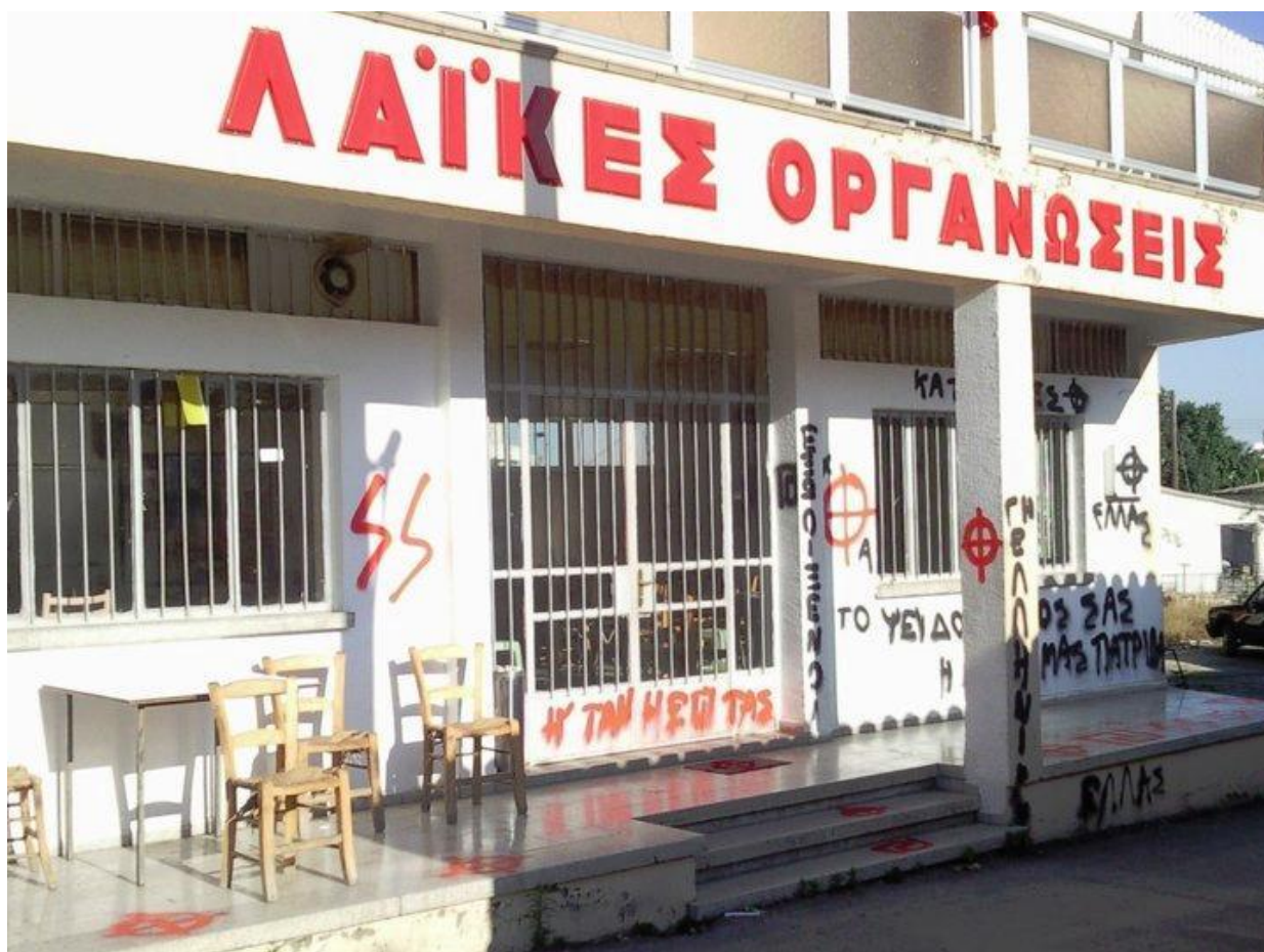
Βανδαλισμοί σε αριστερό σωματείο στην Άγια Βαρβάρα από ακροδεξιούς (01/06/11).